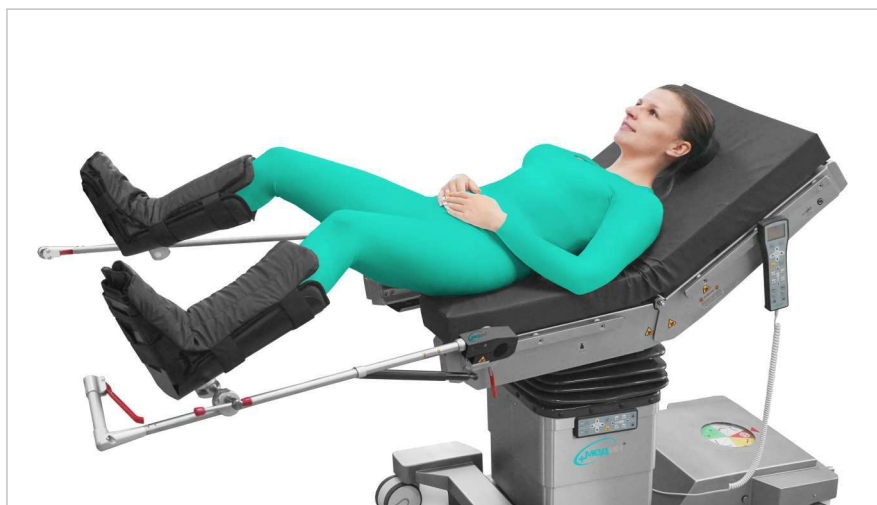
Положение для лапароскопии