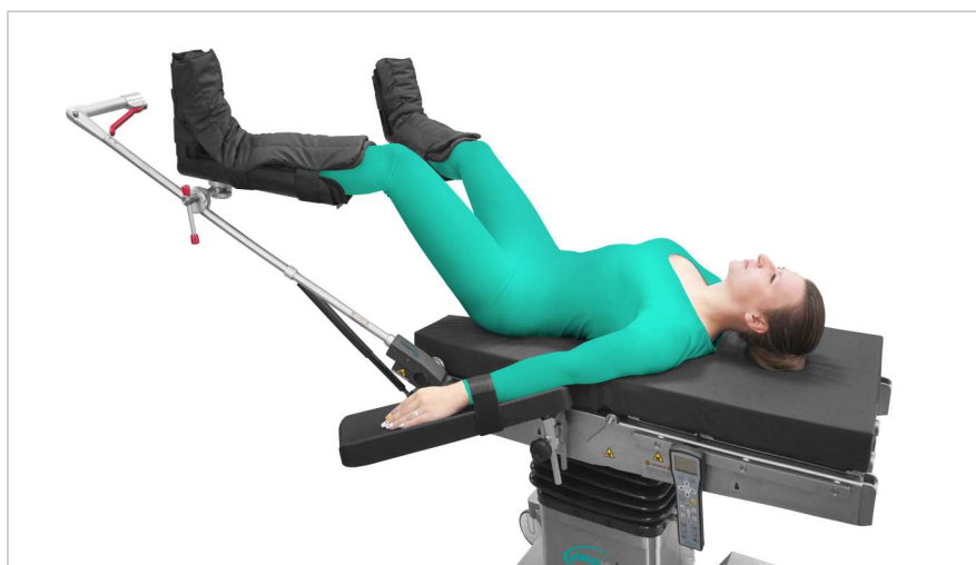
Положение для литотомии