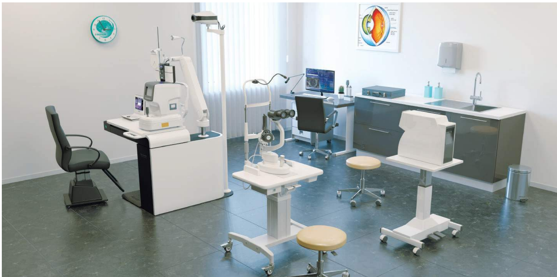
• Авторефрактометр Взор-9000