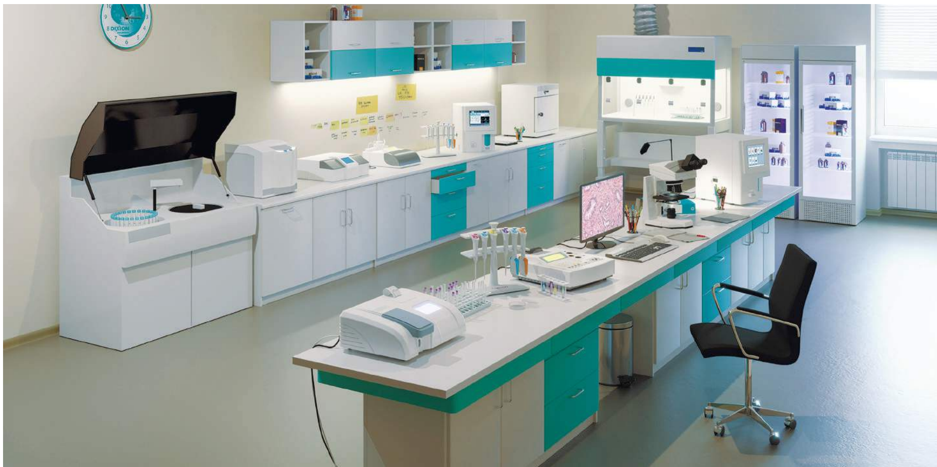
• Коагулометр Realite 1204