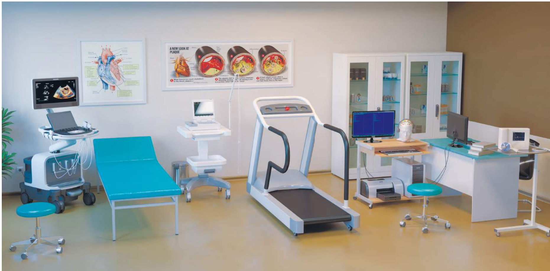
• Медицинская беговая дорожка TM-400