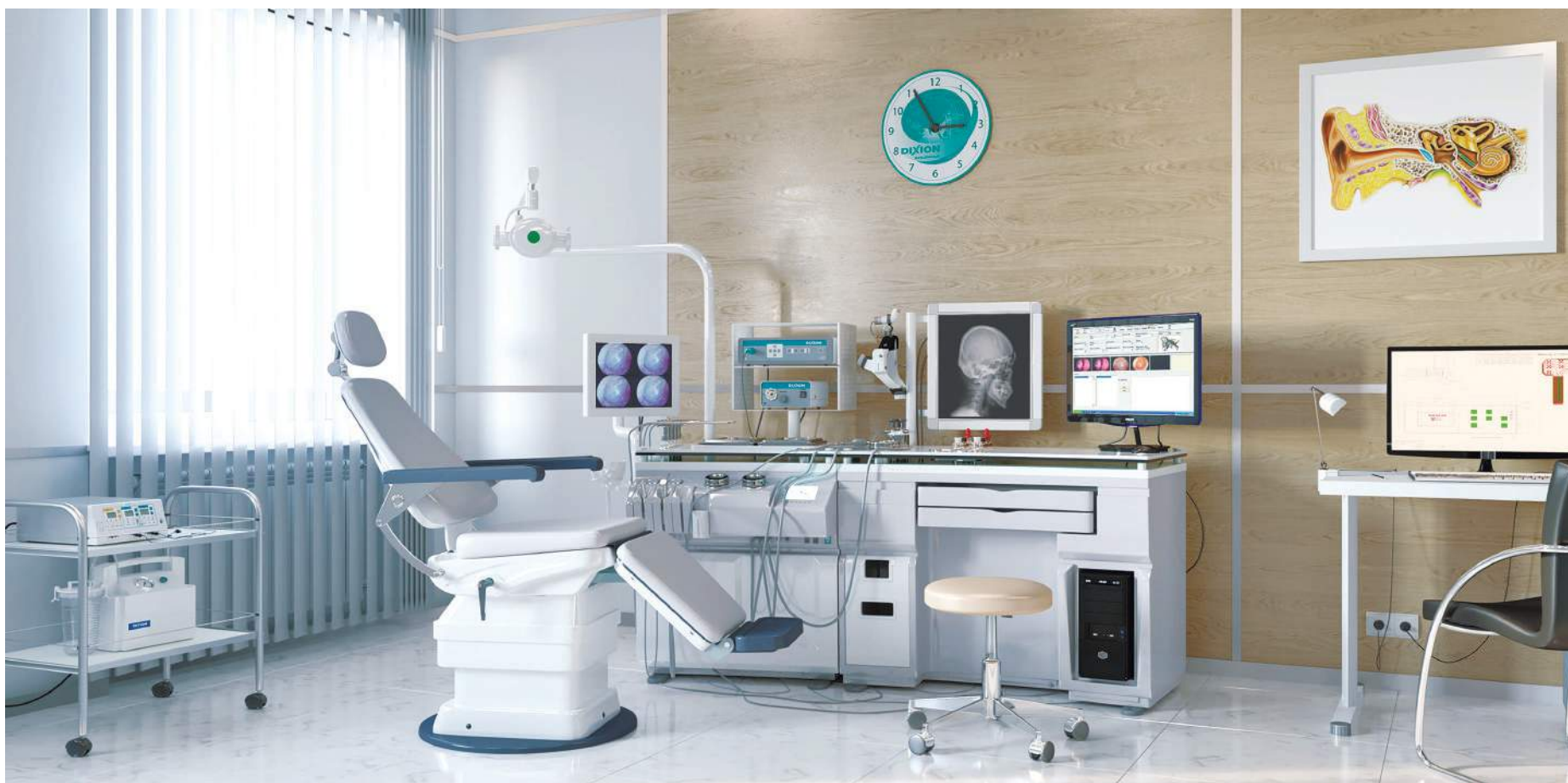
• Рабочее место ЛОР-врача ST-E 900