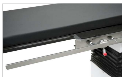
Удлинитель боковой планки стола (принадлежность)