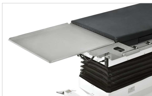
Столик инструментальный (принадлежность)