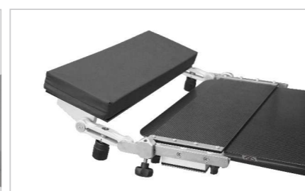
Траверса с подголовником (принадлежность)

Безопасная рабочая нагрузка ..... 220 кг Масса стола ..... 350 кг