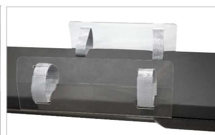
Ограждение для рук (принадлежность)