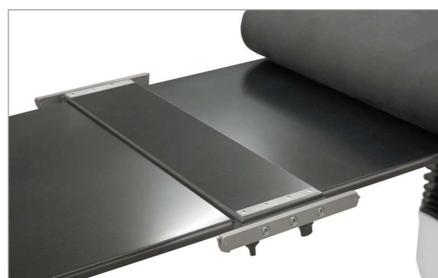
Траверса поперечная для монтажа приспособлений (принадлежность)